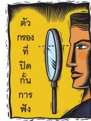
การบิดเบือนทางด้านผู้ฟัง