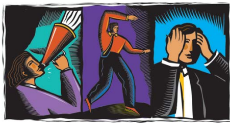
สไตล์การพูด ภาษากาย จุดบอด